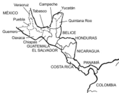
Plan Puebla Panamá

competitividad). En estos temas existen 61 proyectos, de los cuales se han ejecutado 3, y 33 se encuentran en ejecución en 2007; se han gastado más de 4 527 millones de dólares (PPP, 2007).